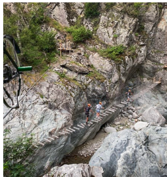
Klassenlager Sedrun - Besuch im Seilpark

Aktuell sind wir bei allen Konten «auf Kurs». Sollten keine grösseren Defekte oder Schäden auftreten, hoffen wir, im vorgesehenen Rahmen abschliessen zu können. Im Zuge der Sanierung des Gotthelfweges haben wir in Absprache mit der Gemeinde unsere Abwasserleitungen untersuchen lassen. Einige unserer Schmutzwasserkanäle weisen kleine Schäden auf, weshalb wir entschieden haben, diese noch im Jahr 2024 sanieren zu lassen. Daher werden wir voraussichtlich das Gebäudeunterhaltskonto etwas überziehen.