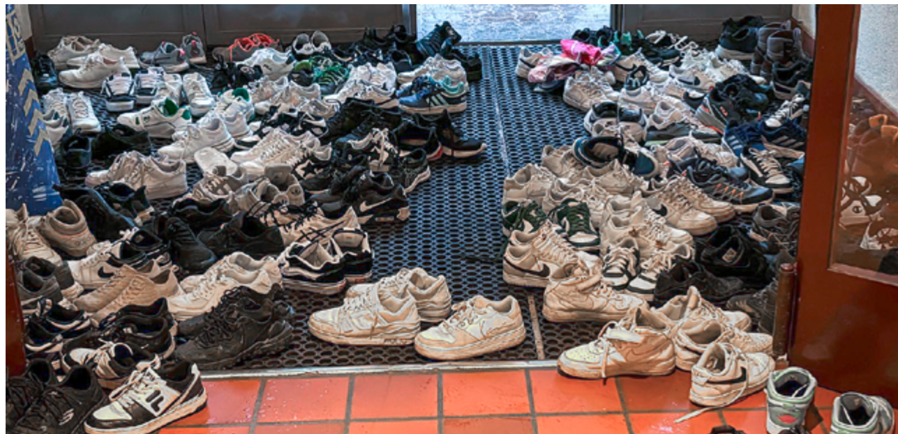
Viele Schüler:innen gehen zur Schule