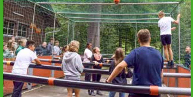
Jahrgangslager Melchtal – Maxxi-Soccer-Turnier

beschlossen, eine Fachperson für schulische Sozialpädagogik einzustellen. Somit führen die neu gegründeten Klassen und die Erweiterung der Schulsozialarbeit zu gestiegenen Lohnkosten und damit zum prognostizierten Defizit von 241'770 Franken für das kommende Kalenderjahr 2026.