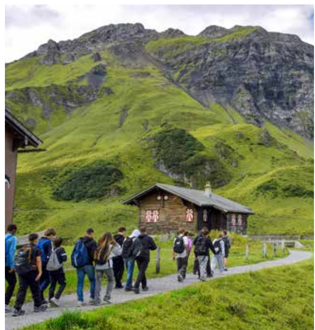
Lagerwanderung 2. Sek

Bis zur Drucklegung dieses Berichtes wurden keine wesentlichen Schäden oder Defekte festgestellt. Die vorgesehenen Pauschalen dürften daher für den laufenden Unterhalt ausreichen. Nach Einschätzung der Steuerverwaltung bewegen sich auch die Einnahmen im Rahmen des Budgets.