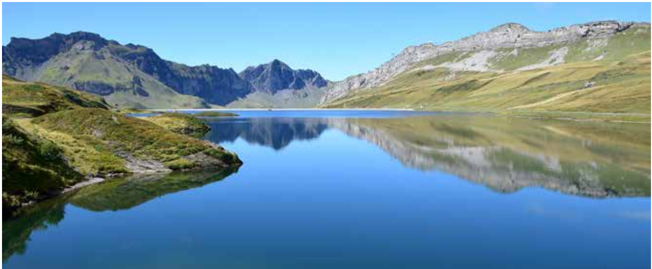
Seenwanderung auf Melchsee-Frut